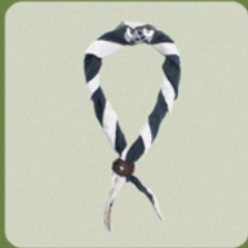
DAS + DASRING