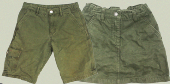
SCOUTS- BROEK OF ROK