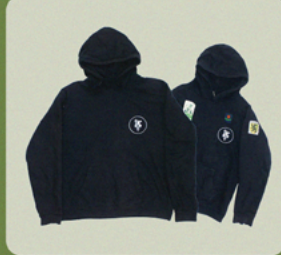
TC TRUI (TOT JY'S MET KENTEKENS)