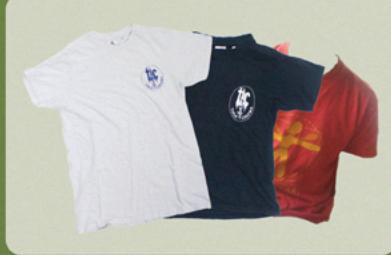
TSHIRT WIT: V + LEI | BLAUW: KAP - JY'S | ROOD: TICTAC